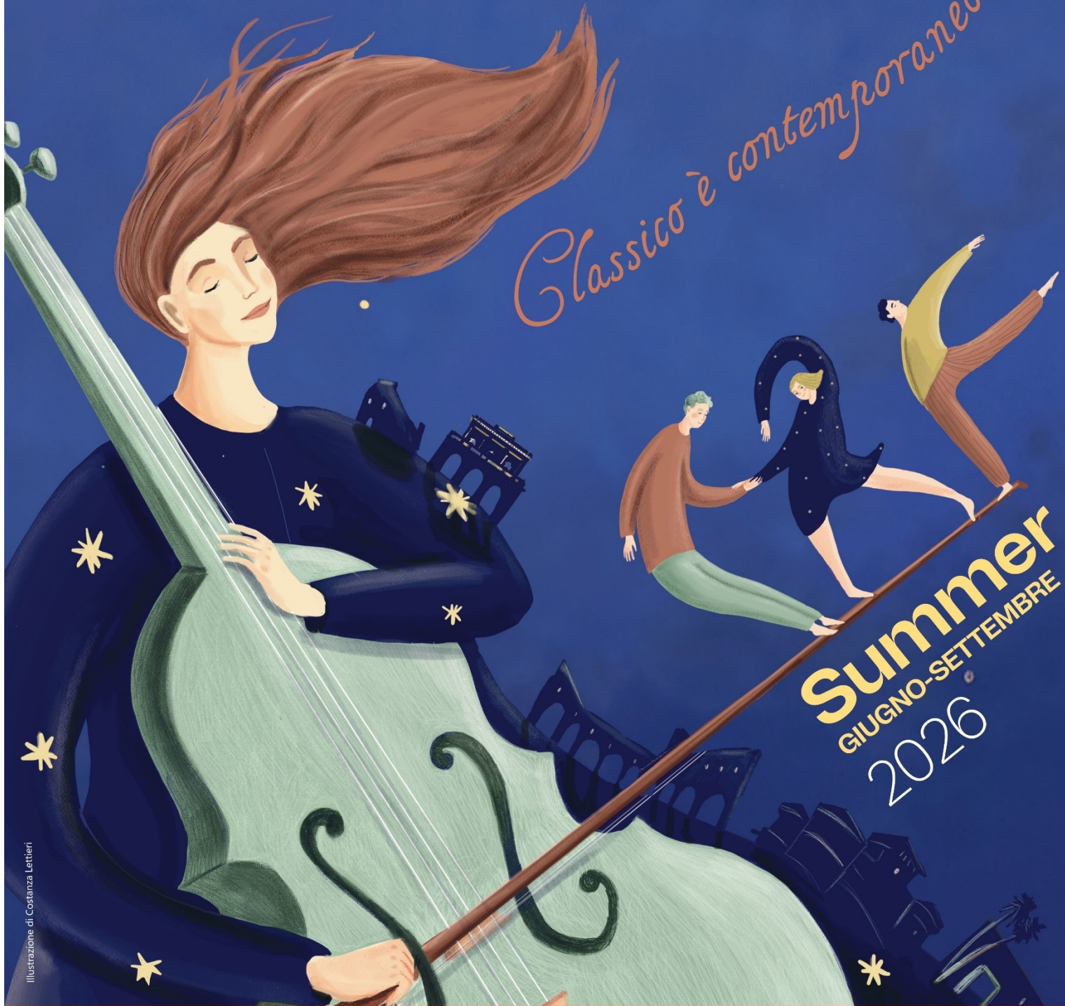
Illustrazione di Costanza Lettieri